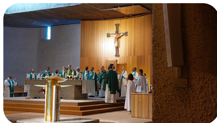
Photos de la rentrée diocésaine 2024