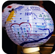
Remise des lettres des missions aux Chefs d'établissement et animateurs en pastorale